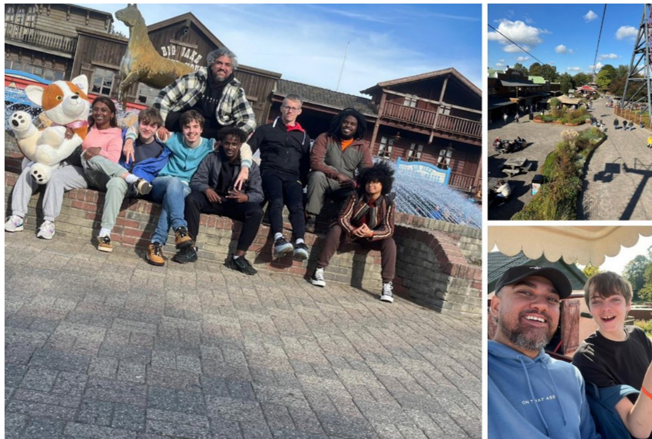
foto : Slagharen met de jongens van De Pastorie

De jongens van De Pastorie zijn voor het eerst een weekendje weg geweest. Dit vond plaats begin oktober. Onderweg in de bus naar Slagharen, een lange rit van 2 uur, mochten ze verzoeknummers opgeven bij de begeleiders waardoor ze dus zingend en swingend naar Slagharen zijn gereden. In Slagharen aangekomen hebben ze genoten van het zwembad met diverse glijbanen als ook van het gezellige etentje in een restaurant. Er waren twee huisjes gehuurd. Voor sommige jongens was het echt wel spannend maar juist met een vertrouwde groep inclusief hun vaste begeleiders om hun heen, gaf het hen ook veel zelfvertrouwen en een heerlijk gevoel van vrijheid en volwassenheid. Van het budget hebben ze ook 4 bordspellen mogen kopen en die waren natuurlijk ook ingepakt! Er zijn dat weekend echt veel spelletjes gespeeld. Ook het weer zat mee dus ze kijken terug op een heerlijk relaxed weekendje uit. Absoluut voor herhaling vatbaar.