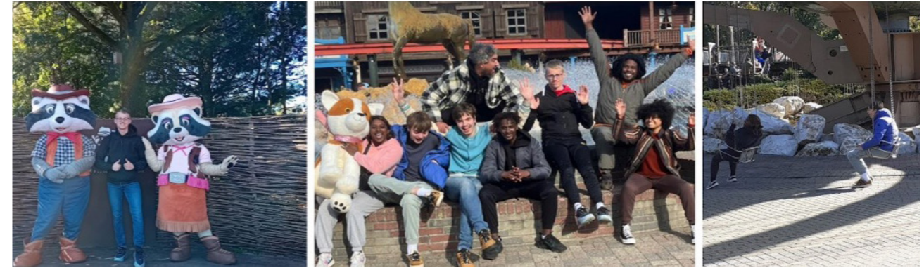
foto : Slagharen met de jongens van De Pastorie

Wat ook fijn was is dat er voor de bewoners van De Pastorie een budget gereserveerd is voor het vieren van verjaardagen plus een cadeautje en het kopen van de Rotterdampassen voor wie dat niet zelf kan betalen. Dat maakt dat de jongeren ook hier onderling met elkaar veel gebruik van kunnen maken en ook wat meer op stap kunnen.