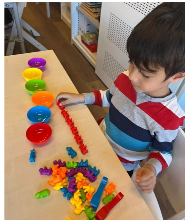
foto : ontwikkelmaterialen voor De Uitvinders - Den Haag