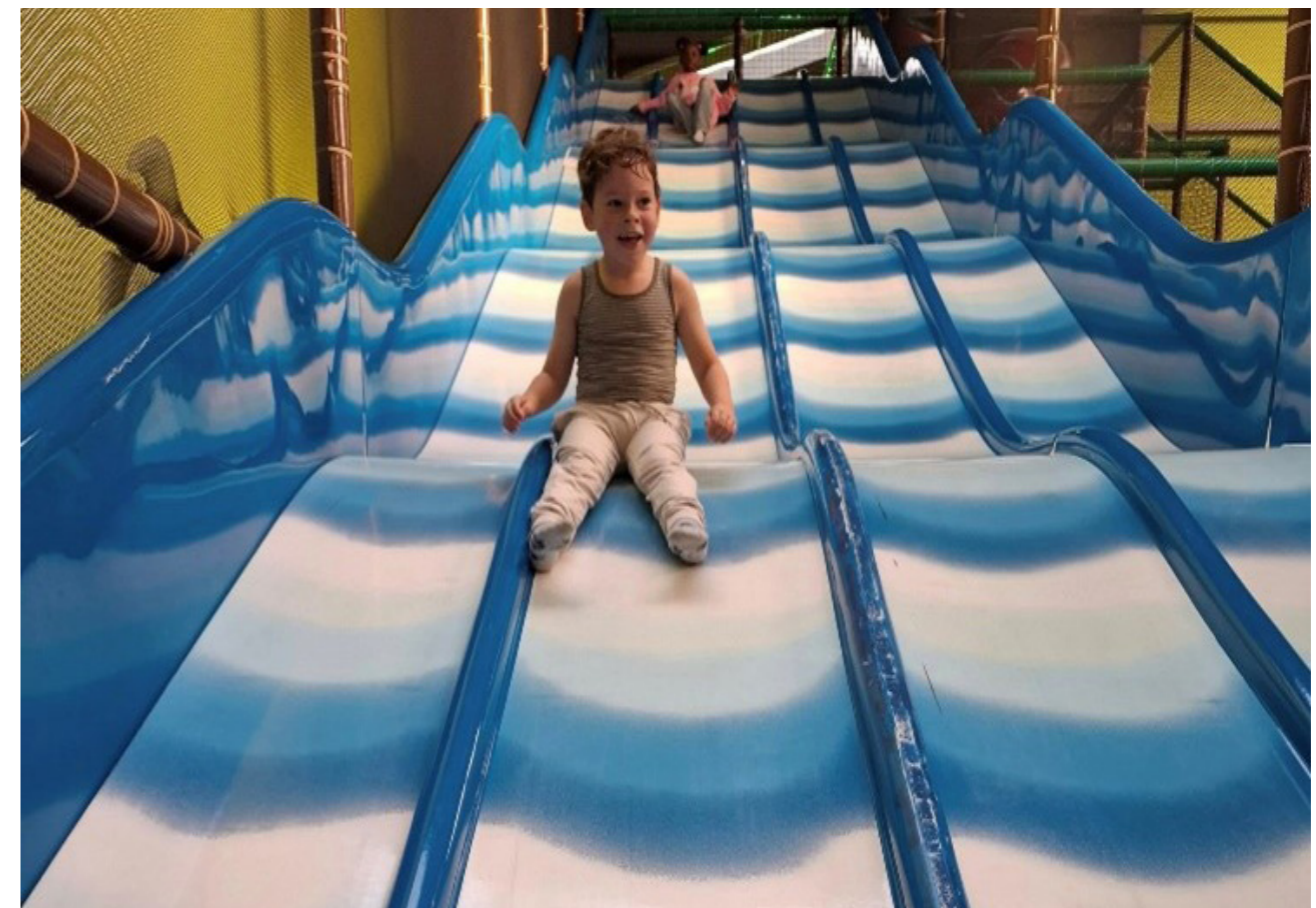
foto: bezoek van De Uitvinders en De Lichtmast aan MokeyTown Rijswijk

De meeste kinderen zijn begeleid door één van hun ouders en de rest van het gezin kon eventueel ook mee tegen betaling van een speciaal CityKids tarief.