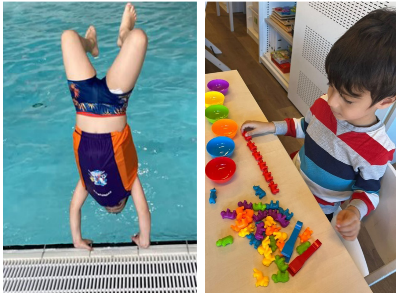
foto : waterpret in het Alexanderhof zwembad

Sinds november 2023 kunnen de kinderen van Het Droomhuis ook een uurtje waterpret beleven in het zwembad Alexanderhof. De kinderen maken (figuurlijk) grote stappen in het zwembad. De eerste keer willen ze het water niet in en een paar weken later willen ze het zwembad niet uit. Sinds kort is er ook plek voor een aantal kinderen van De Componist om te komen genieten van het uurtje waterpret, onder begeleiding van één van hun ouders. En als het vakantie is dan mogen ook de broers en zussen meegenieten.